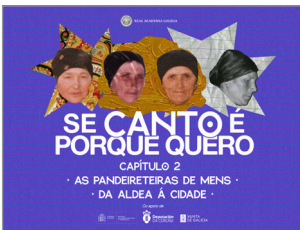
As pandeireteiras de Mens. Da aldea á cidade Capítulo 2