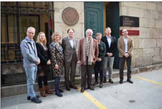
Visita do consello consultivo para o idioma frisón. 23 de xaneiro de 2020.

31 de decembro de 2020. O Dicionario da Real Academia Galega superou en 2020 as 38.500.000 buscas, máis de 105.000 ao día de media. As consultas medraron case un 50 % con respecto ao ano 2019, cando xa se producira un incremento por riba do 18 % con respecto ao 2018 e se chegara ás preto de 26.0000.000 procuras. A entrada en vigor do primeiro estado de alarma por mor da pandemia marcou un punto de inflexión e rexistrou a marca histórica de buscas no mes de maio de 2020, que pechou con máis de 4.800.000.