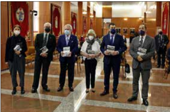
Presentación de Polos camiños das horas. Epistolario de Ricardo Carballo Calero e Ramón Otero Pedrayo. 15 de xaneiro de 2021.