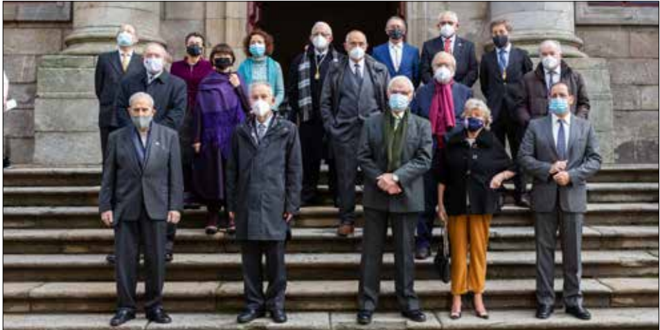
Asistentes ao plenario extraordinario do Día das Letras Galegas.