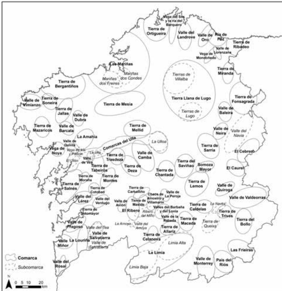
Mapa 1. Distribución comarcal de Fraguas. Elaboración de Alejandro Otero Varela.

Revisar algunhas pasaxes comarcais do noso autor pódenos valer para ilustrar o que se vén de contar. Así, queremos percorrer a bacía do Arnoia da súa man. Preto do seu nacemento, establece a Terra de Maceda, “una gándara cultivada procedente de antiga cubeta deshidratada” (1953: 263), nunha descrición que expresa á perfección a interrelación, inextricábel, do natural e do cultural. Acerca desta comarca, cómpre salientar que a circunscribe estritamente ao val do río Maceda, tributario do Arnoia, pois a parte alta do curso deste último é “semeiante a la comarca anterior” (1953: 263), isto é, á Limia, de xeito que non a