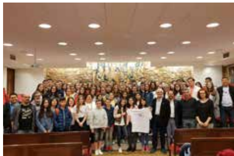
Encontros coa xente nova. Alumnos do IES da Pobra do Caramiñal e do Colexio Fogar de Santa Margarida participantes en 21 días co galego . 8 de maio de 2018.