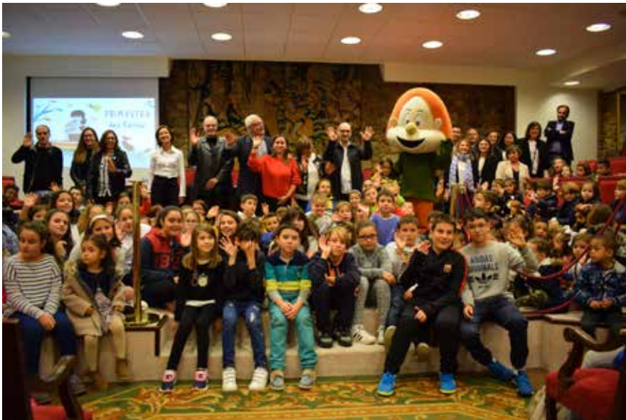
Participantes na entrega dos premios Contádenos o voso Día das Letras.

A radio, a poesía e a música encheron a institución no acto de entrega dos galardóns da man de máis dun cento de nenos e nenas dos tres centros gañadores.