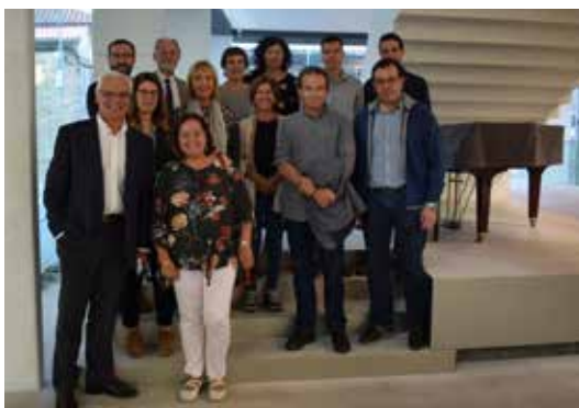
Intervenientes na III Xornada de Onomástica Galega.

Os traballos presentados nesta III xornada, así como os estudos de onomástica tratados na mesa redonda, recolléronse no volume da Sección de Lingua Estudos de Onomástica Galega III: os alcumes , en edición da académica correspondente Ana Boullón.