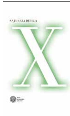
Cuberta de Natureza de Illa .