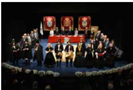
Os de Algures pecharon o acto coa interpretación do Himno Galego.

O grupo Os de Algures púxolle o ramo á celebración coa interpretación do Himno galego.