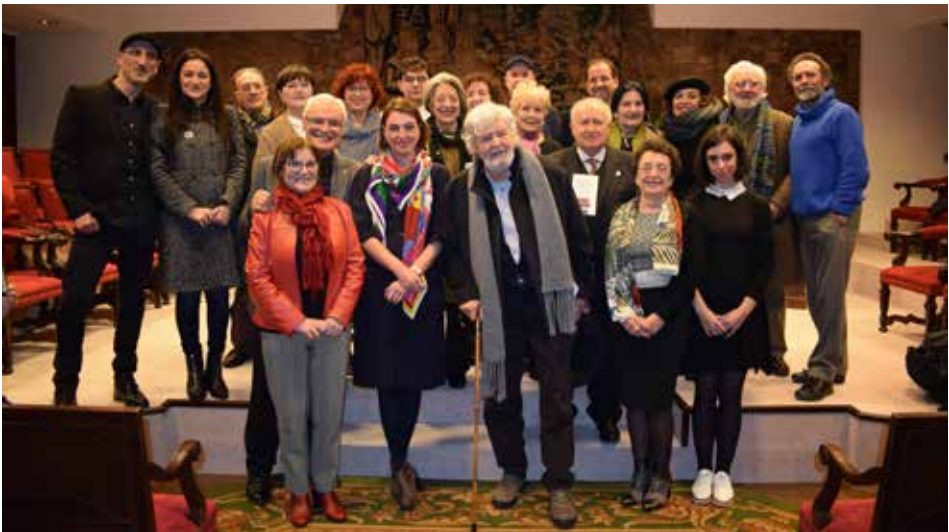
Os participantes no acto.