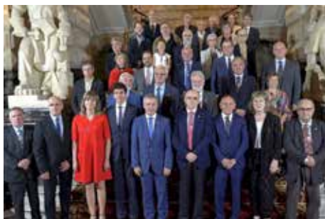
Membros de Euskaltzaindia, representantes das demais academias e autoridades políticas nas escaleiras do Pazo Foral de Biscaia. 20 de xullo de 2018.