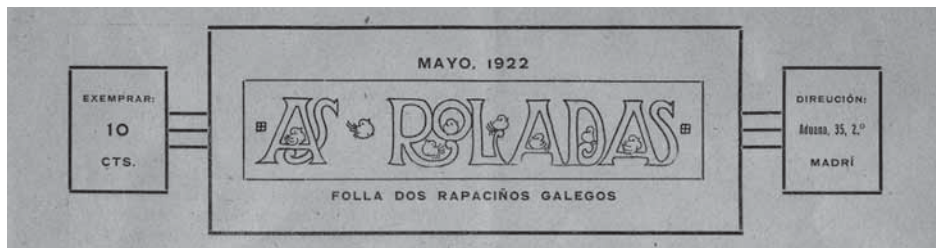
Cabeceira do xornaliño As Roladas

substituír totalmente, sen deixaren de expresar fervoroso nacionalismo, o que antes eran berros de loita e verbas de orgullosa autoafirmación: