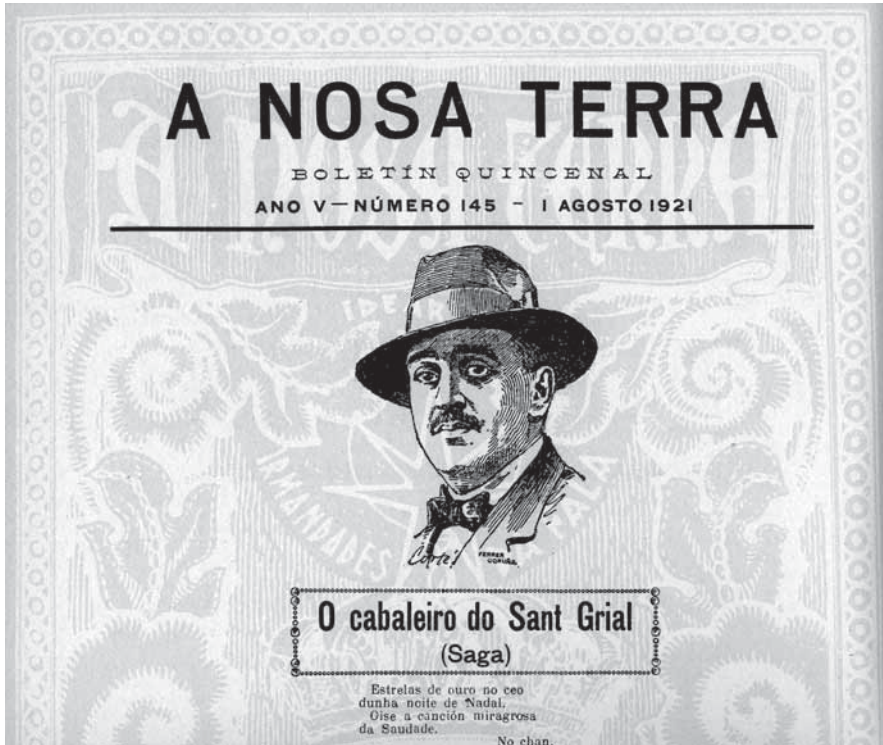
Cabanillas en A Nosa Terra .

mencionar especialmente a presente no seu número inaugural, “A traxedia das follas”, o emblemático “¡En pé!” e o poema “Meu carriño”, que aparece no oitavo número (25/I/1917) adornado cunha dedicatoria ben elocuente: “Prá y-alma acesa de Antón Villar Ponte”: