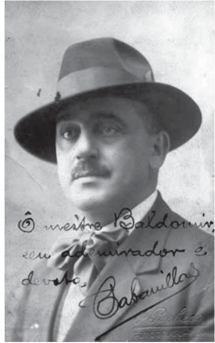
Cabanillas nos anos 20.

O éxito da peza foi indiscutíbel (Anónimo 1919) e A man de Santiña representouse logo en moitas outras localidades galegas. Editouse na imprenta de Mondariz Balneario en xaneiro de 1921. No remol deste éxito e coa mesma intencionalidade, esteticamente renovadora e ideoloxicamente propagandística, afrontaría Cabanillas de inmediato dous novos proxectos teatrais: un libreto para ópera que lle encargou o mestre Xosé Baldomir baseado no célebre poema de Curros “A Virxe do Cristal”, proxecto que protagonizou unha malfadada peripecia (Ferreiro/Sanmartín 2002) e unha peza en verso de teatro histórico feita “a medias” con Antón Villar Ponte, O Mariscal .