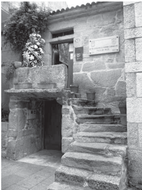
Casa natal de Cabanillas, en Fefiñáns.