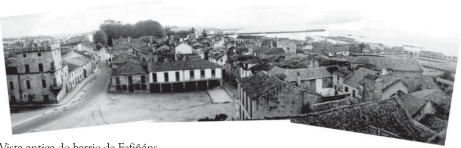
Vista antiga do barrio de Fefiñáns.