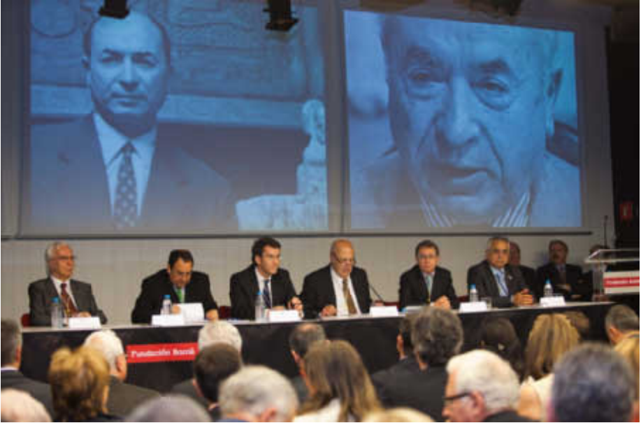
Mesa presidencial durante a Sesión plenaria extraordinaria do Día das Letras Galegas. Real Academia Galega. Arquivo / Foto: Xosé Castro.