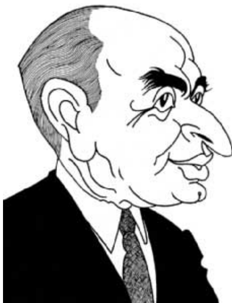
Caricatura de Valentín Paz-Andrade, por Siro.