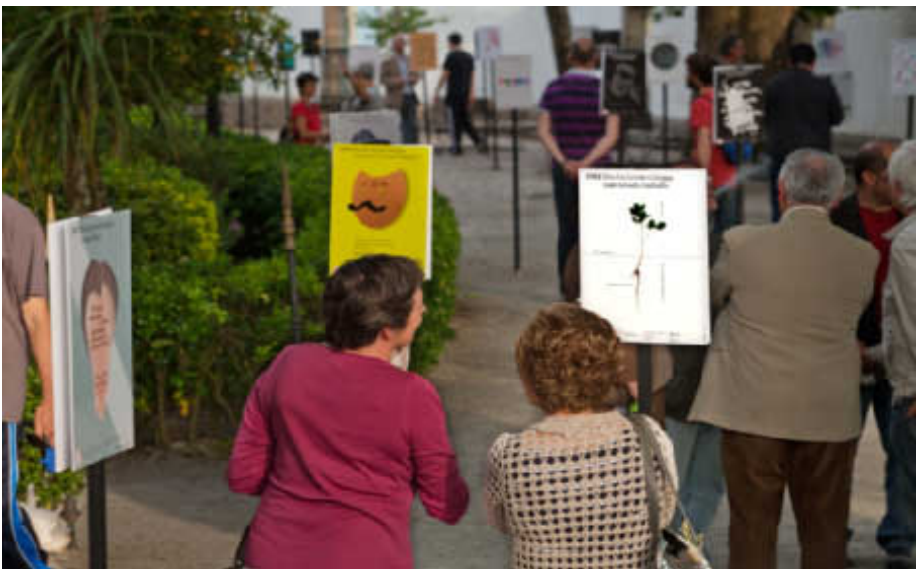
Os asistentes percorren a exposición.