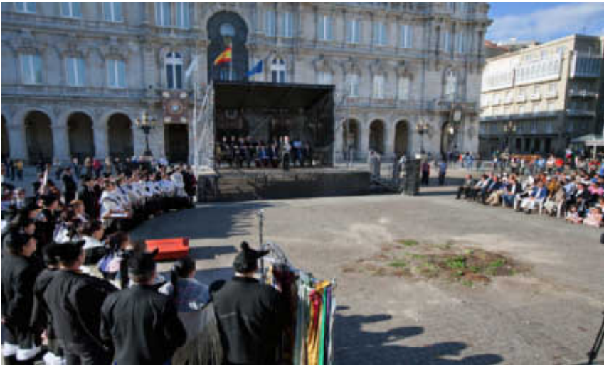
O presidente da Real Academia Galega intervén desde a bancada dos académicos e autoridades. No primeiro plano á esquerda, a coral Cántigas da Terra. Real Academia Galega. Arquivo / Foto: Xosé Castro.