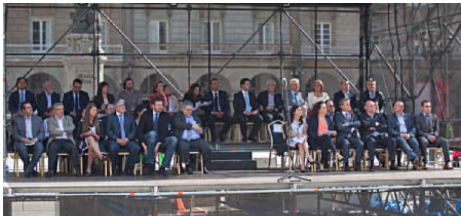
Aspecto xeral da bancada desde a que os alcaldes e outros representantes civís recitaron os textos dos homenaxeados.