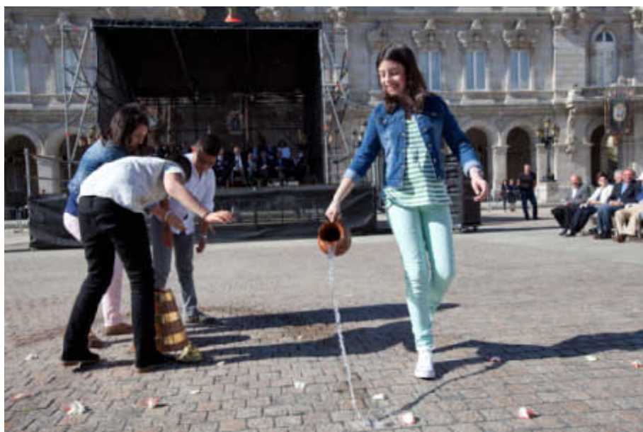
Escolares de Mondoñedo deitan auga da Fonte Vella de Cunqueiro na “leira da palabra”.