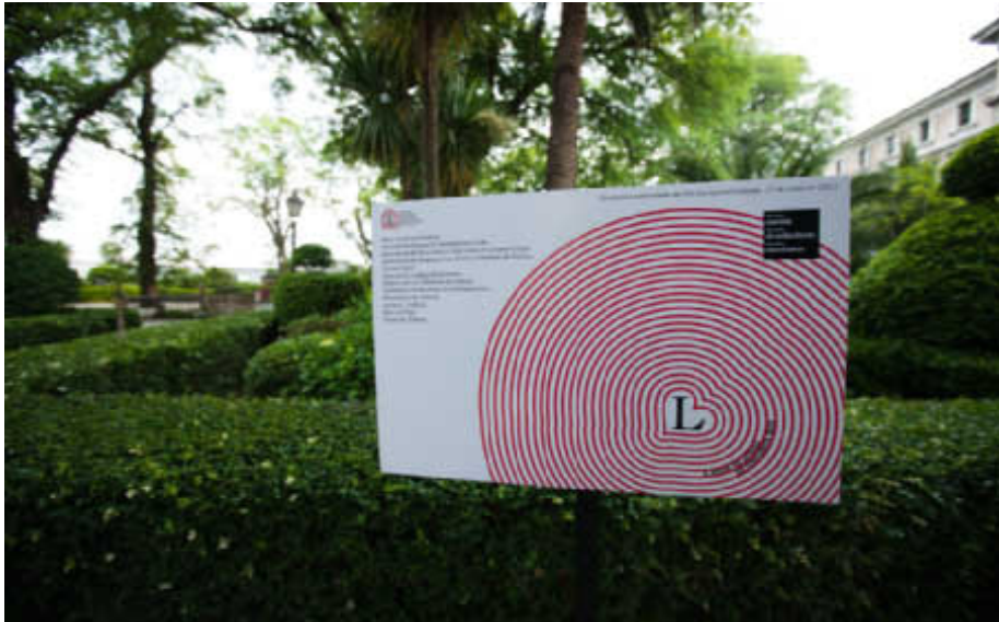
Entrada á exposición de carteis, nos xardíns de San Carlos (A Coruña). Real Academia Galega. Arquivo / Foto: Xosé Castro.

Máis de cen persoas, entre deseñadores, escritores, personalidades da cultura e público xeral, asistiron á celebración que escolleu como palco o corredor circular situado sobre a ría da Coruña.