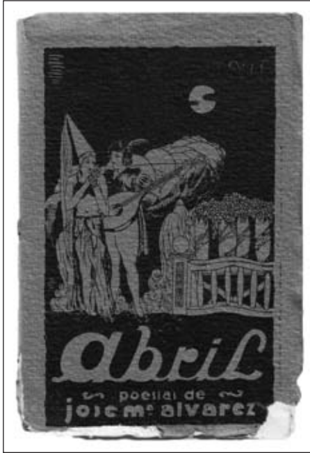
Portada do seu primeiro libro Abril (1932).