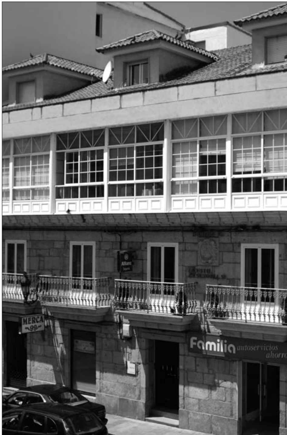
Casa natal de Xosé María Álvarez Blázquez, no actual Paseo da Corredoira.