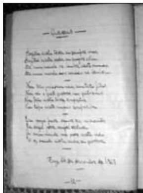
Manuscrito do seu primeiro poema “Queixas”, 24 de decembro de 1927.