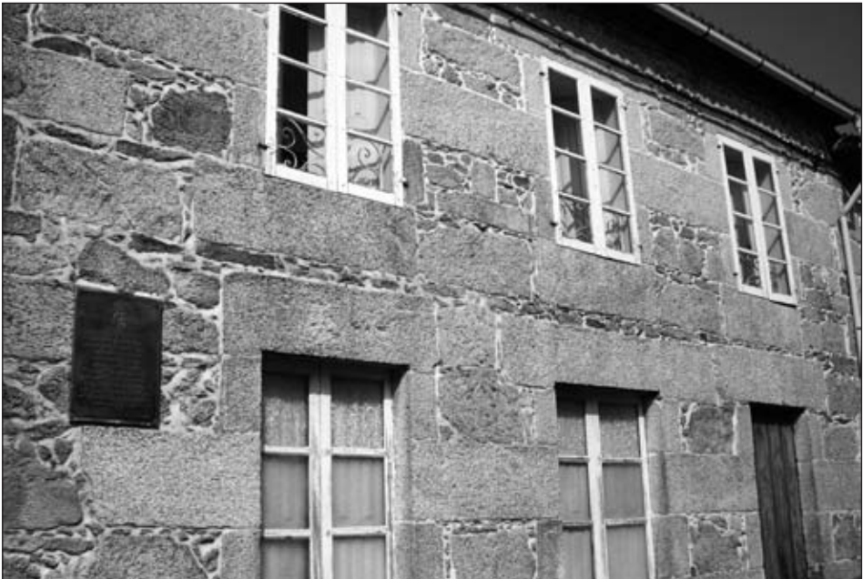
A casa do Rollo, residencia familiar en Tui.

Unha aprendizaxe que logo lle serviu a Álvaro para promover dende a Serigrafía Galega, fundada en 1971, unha singular achega á difusión da arte contemporánea de Galicia. Pois tamén Álvaro colaborou, dende unha nidia vocación galeguista, na promoción da nosa cultura, especialmente, polo que nos atinxe agora, na súa participación na fundación da editorial Castrelos. Do mesmo xeito, a súa condición de tudense foi sempre mantida con especial orgullo a pesar das tráxicas circunstancias que lle rememoraban a vella cidade miñota.